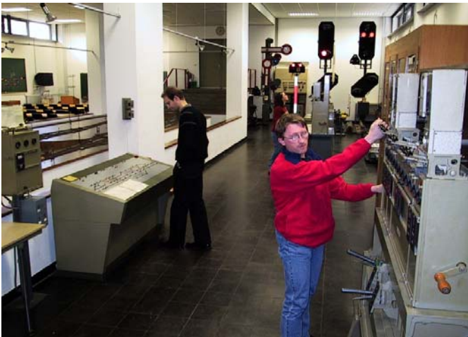
Ausbildung an der Eisenbahnsicherungstechnischen Lehr- und Versuchsanlage

Prozessgestaltung für den gesamten betrieblichen Planungsprozess sowie die Automatisierung eines Großteils der Prozessschritte ermöglichen wird. Das VIA arbeitet auf diesem Gebiet eng mit der DB Netz AG und der DB Systems GmbH, dem Systemhaus der Deutschen Bahn, zusammen.